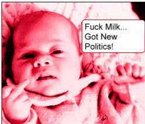
Die Milch machts ...

Wie kommt es dann, dass gerade MILCH dem Körper Kalzium entzieht anstatt ihn damit zu versorgen? Dies ist so, weil Milch neben Kalzium auch jede Menge Phosphate enthält und eine bestimmte Sorte EIWEISS, nämlich KASEIN-EIWEISS. Dieses Eiweiß ist für den Menschen ARTFREMDE. Trinkt man Milch, dann bindet die Magensäure 50-70% des Kalziums der Milch, welches somit im Darm nicht aufgenommen wird. Es wird wegen des HOHEN EIWEISSGEHALTES in der Milch noch zusätzlich mehr Kalzium über den Urin ausgeschieden, als durch die Milch aufgenommen wurde. Es findet eine ÜBERSÄUERUNG DES BLUTES statt, denn Milcheiweiß enthält DREIMAL MEHR schwefelhaltige Aminosäuren als pflanzliches Eiweiß. Um eine Übersäuerung des Blutes zu verhindern, muss der Körper reagieren und einen BASISCHEN AUSGLEICH schaffen. Dies tut der Körper, indem er AUS DEN KNOCHEN das basische Kalziumphosphat löst (es also den Knochen ENTZIEHT) und damit die Säurebildung durch das Milcheiweiß zu neutralisieren versucht. Das Endprodukt dieses Stoffwechselforgangs wird über den Urin ausgeschieden. WIE säurehaltig dieser Urin ist, kann man in den öffentlichen Toiletten riechen.