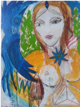
2.' Self / Selbst' IV - 2013 ÖL, Acryl, Kohle, Erde auf Leinen 110cm x 90 cm