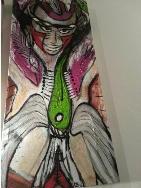
4. Shambala Krieger V-2013 Diptychon ÖL, Acryl, Kohle, Erde auf Leinen je 80 x 40cm