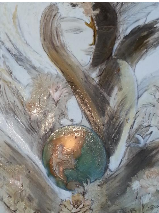
5. Flowering / Blüten V-2013 Erde, Öl, Lacke, Acryl, Kohle, Papier 80x60cm

Vor seinem Bauch trägt er einen stilisierten Vogel, welcher seine Essenz, sein Heiligstes ( unten rot im Bild) beschützt. Der Shambala- Krieger kämpft ohne zu kämpfen. Das ist die höchste Kunst des Kämpfens. er ist im Fluss mit dem Leben und ohne Furcht. Er ist der Regent des erfüllten Lebens vereint mit allen Kräften der Natur.