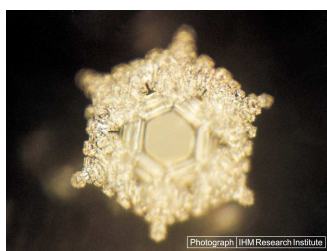
Wasserkristall mit der Beschriftung „Liebe & Dankbarkeit“

Die Basis zum Buch ist die langjährige Forschungs- und Entwicklungsarbeit von Dr. Masaru Emoto, der uns allen mit seinen wundervollen Bildern von gefrorenen Wasserkristallen faszinierende Einblicke in das Wesen des Wassers ermöglicht hat.